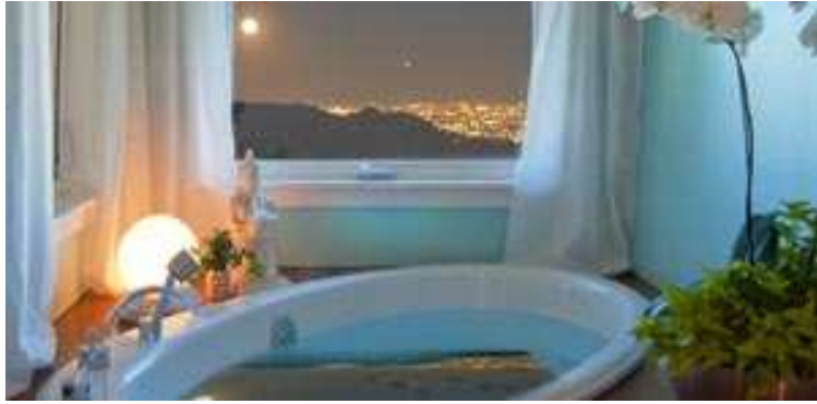
Mit acht Zutaten das Badezimmer zum luxuriöses SPA machen.